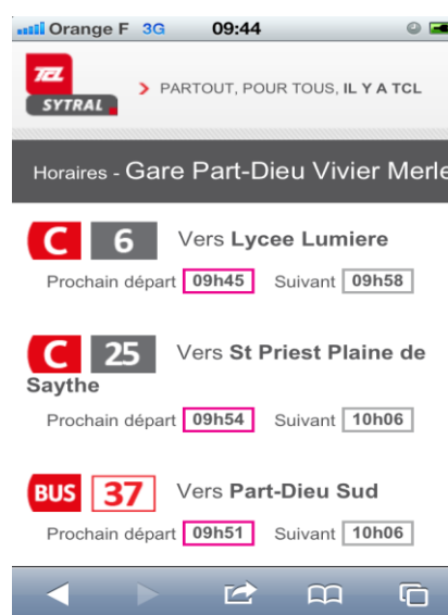
Capture d'écran smartphone

Présents sur les fiches horaires affichées à tous les arrêts de bus, ces petits pictogrammes noir et blanc, viennent compléter l'offre des bornes Visulys déjà placées aux arrêts les plus fréquentés. Les utilisateurs munis d'un Smartphone et ayant téléchargé l'application permettant la lecture des flashcode, peuvent désormais bénéficier de ce nouveau service d'information en temps réel. Après avoir scanné le flashcode, les horaires des prochains passages des lignes desservant l'arrêt auquel il se situe, seront instantanément affichés.